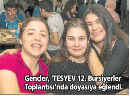
Gençler, 'TESYEV 12. Bursiyerler Toplantısı'nda doyasıya eğlendi.

V. A. Dicle Üniversitesi Mimarlık Fakültesi